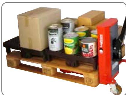
En kvartspall lyfts från EUR-pallen med LogiQ 300 och kan flyttas till displayplatsen i butiken.