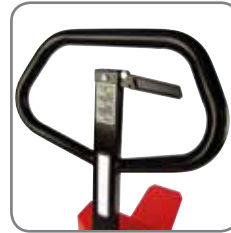
Den ergonomiska greppvinkeln ger användaren ett avslappnat grepp.