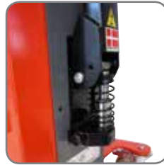
LogiQ 300 har en hydraulisk pump vilket minimerar antalet pumptag.