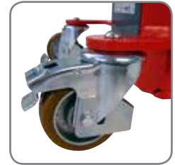
Parkeringsbroms på LogiQ 300.