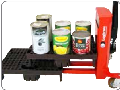
LogiQ 300 kan utan några problem hantera den övre kvartspallen.