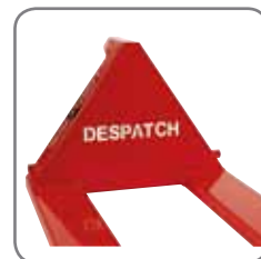
Företagets namn/logo kan skäras ut i gaffelbröset.