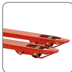
Glidskenor vid gaffelspetsarna gör att Panther lätt kan köras in och ur pallar.