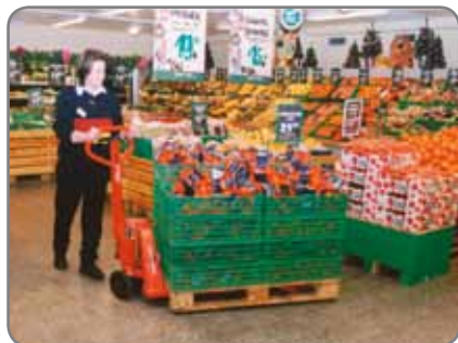
Justerbar gaffelhöjd - inga problem med låga och nerslitna pallar.

Gaffellyftvagnarna finns också i rostfria och explosionsssäkrade utföranden.