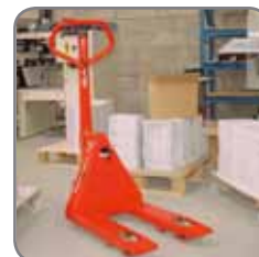
Panther kan levereras med många olika gaffellängder.

Vi erbjuder också kundpassade lösningar.