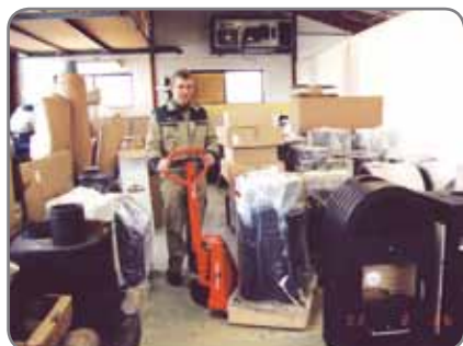
Även i mycket trånga områden får man en problemfri hantering av godset.