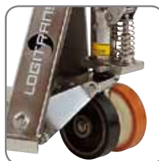
Möjlighet till olika hjulmonteringar som passar användarens behov.