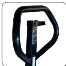
Det ergonomiska handtaget ger ett avslappnat grepp. Möjlighet till märkning med namn/avdelning.